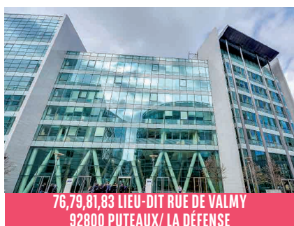
76,79,81,83 LIEU-DIT RUE DE VALMY 92800 PUTEAUX/ LA DÉFENSE

Découvrez également votre espace associé et ses fonctionnalités.